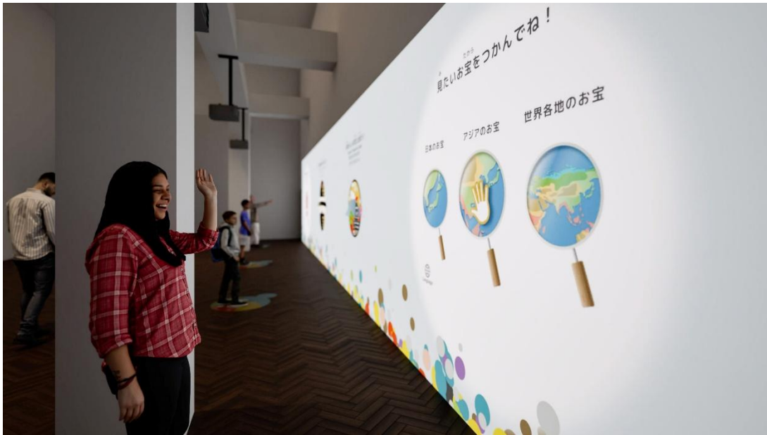
モーションセンサーにより、体の動きに合わせてリズムカルに操作を楽しめる仕掛けを導入

来館者の興味関心に応じて東博のコレクションとの出会いを創出するコンテンツを展開しています。映像の前に立つと体験が始まり、当日展示されている約 3,000 件の作品情報と連動しながら、6 種類の切り口の中からランダムに選ばれた 4 種類のコンテンツがリアルタイムに生成・表示されます。