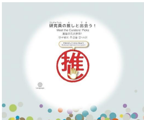
①研究員の推しと出会う！ 東博の研究員が選んだ「推しの名品」が表示されます