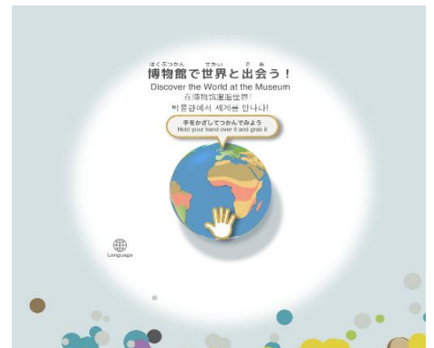
⑥博物館で世界と出会う！ 日本美術・アジアの美術・世界の美術 3つのテーマから1つを選んで、作品を紹介