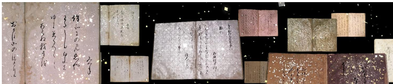
王朝のきらめきが、動き出す「古今和歌集(元永本)」

東博に來訪して“最初に出会う展示”として、博物館全体やこの後の展示室で待つ作品たちの魅力を伝える約2分間の特別映像です。映像は幅14メートルの大型スクリーンに映し出され、1872年の湯島聖堂博覧会から、2022年の創立150周年までの歴史を軸に、「松林図屏風」や「古今和歌集(元永本)」、「遮光器土偶」など、東博を代表する名品が数多く登場します。この映像を通して、日本美術とアジア・世界の美術作品との深いつながりや、東博コレクションの多彩さを感じることができます。さらに、法隆寺宝物館や黒田記念館などの展示館も横断的に紹介しており、東博構内をめぐる楽しさや、国や時代、ジャンルの違う作品に新しく出会うワクワク感も実感できる構成になっています。※この特別映像はインタラクティブコンテンツの合間に、15分ごとに上映されます。