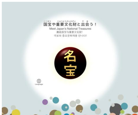
④国宝や重要文化財と出会う！ 特に国宝・重要文化財のなかから一点をピックアップ