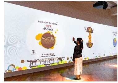
スクリーンに設置されたモーションセンサーが身体の動きを読み取ることでコンテンツが展開。小さなお子さまも車いすのお客さまも体験することができます。

研究員が選んだ「推し」の名品を紹介するコーナーや、ガラポンを回して、その人だけの名品を提示するコーナーなど、切り口は 6 種類。そのうち 4 種類がランダムに表示されます(※コンテンツ詳細は下記参照)。作品と一緒に展示館および展示コーナーも表示されるので、実物の文化財にも迷わずアクセスすることができます。また、日本語・英語・中国語・韓国語の 4 か国語対応になっており、国内外の多くの来館者が楽しめます。スクリーン上の 6 つのコンテンツはスペシャルムービーの上映後ごとに切り替わります。