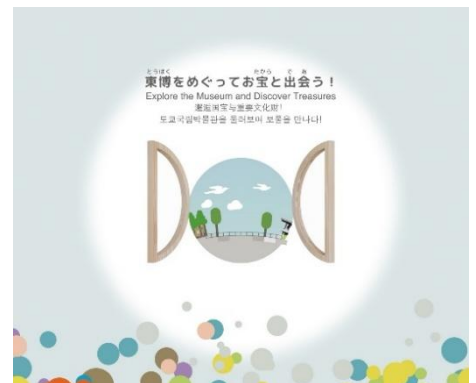
③東博をめぐるってお宝と出会う！ 散策がてら出会う、少し離れた展示館にある名品を提案します