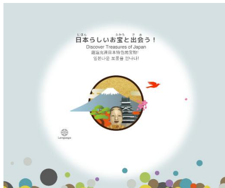
⑤日本らしいお宝と出会う！ サムライ、古典芸能、きもの…。「日本」と聞いてイメージされる展示作品と出会えます