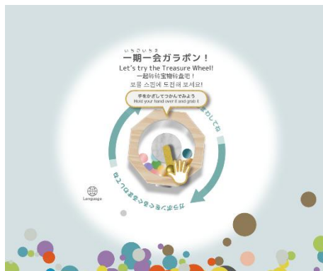
②一期一会ガラポン！ その日、その時の運。くじ引きのようにガラポンを回して、「見るべき一点」と出会います