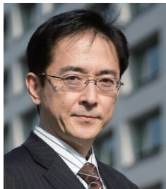
総務省 大臣官房 サイバーセキュリティ・情報化審議官 (併任 内閣審議官(副政府CIO))

これからの「公務」の在り方考える ～組織運営の形、人材マネジメントの形の再設計～